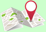
موقعیت روی نقشه