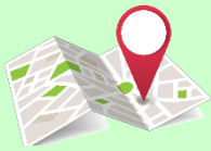
موقعیت روی نقشه