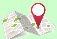
موقعیت روی نقشه