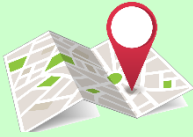
موقعیت روی نقشه