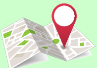
موقعیت روی نقشه