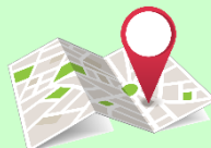
موقعیت روی نقشه